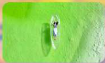
ทะเลสาบเกลือฉางซ่า