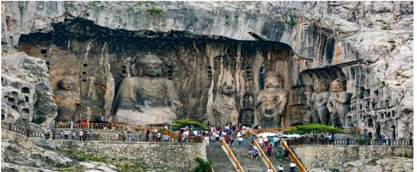
จุดชมวิวที่เหมาะสมสำหรับการถ่ายภาพการแกะสลักและจารึก ภาพสลักกว่า 100,000 ภาพบนผาหิน ประกอบด้วยพระพุทธรูป ภาพเทพเจ้า และจารึกต่างๆ ที่มีความสำคัญทางประวัติศาสตร์

วัดถ้ำผาลงเหมิน (Longmen Grottoes) (รวมรถแบคเตอร์) (ระยะเวลาเดินทางขึ้นอยู่กับโรงแรมที่พัก) ถ้ำผาลงเหมินเป็นหนึ่งในแหล่งมรดกโลกที่สำคัญที่สุดของจีน เป็นวัดและแหล่งแกะสลักโบราณที่อยู่บนหน้าผาหินปูนทั้งสองฝั่งของแม่น้ำอี้ (Yi River) โดยมีพระพุทธรูปและภาพสลักกว่า 100,000 รูป ในถ้ำกว่า 2,300 ถ้ำ สร้างขึ้นในช่วงราชวงศ์เว่ยเหนือ (Northern Wei) ไปจนถึงราชวงศ์ถัง (Tang Dynasty) ถูกตั้งให้เป็นมรดกโลกขององค์การยูเนสโก ค.ศ.2000 ชื่อ หลงเหมิน หมายถึง ประตุมังกรเนื่องจากภูมิประเทศที่มีลักษณะเหมือนประตูหินที่ล้อมรอบแม่น้ำอีไฮไลต์ของที่นี่ พระไวโรจนะ (Vairocana Buddha) พระพุทธรูปองค์ใหญ่สูงถึง 17.14 เมตร (พระเศียรสูง 4 เมตร) เป็นศิลปะที่สร้างขึ้นในยุคราชวงศ์ถัง สื่อถึงความเจริญรุ่งเรืองทางศาสนาและศิลปกรรมในยุคนั้น ถ้ำ Guyangdong ถ้ำเก่าแก่ที่สุดในหลงเหมิน มีพระพุทธรูปแกะสลักขนาดเล็กที่มีความละเอียดสูง สะพานหลงเหมิน (Longmen Bridge) สะพานหินที่เชื่อมต่อหน้าผาสองฝั่ง เป็น