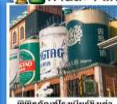
พิพิธภัณฑ์เบียร์ชิงต้า