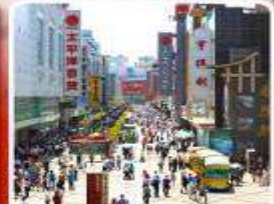
ช้อปปิ้งถนนคนเดินชุนซี