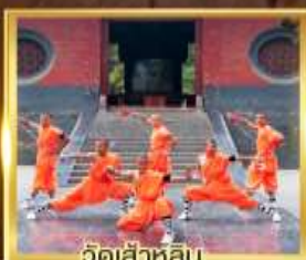
วัดเล่าหลิน