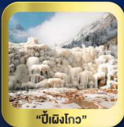
"ปี้เฉิงโกว"

นั่งกระเช้าชมวิว ภูเขาหิมะต้ากู่กลาเซียร์ • ชมความสวยงาม ณ อุทยานปี้เฉิงโกว ห้องสมุดจงซูเก๋ • ศูนย์หมีแพนด้า • ตงเจียวจี้ • ซอยกวางฮอยแคบ