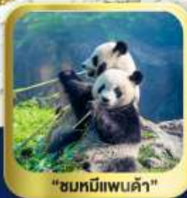
"ชมหมีแพนด้า"