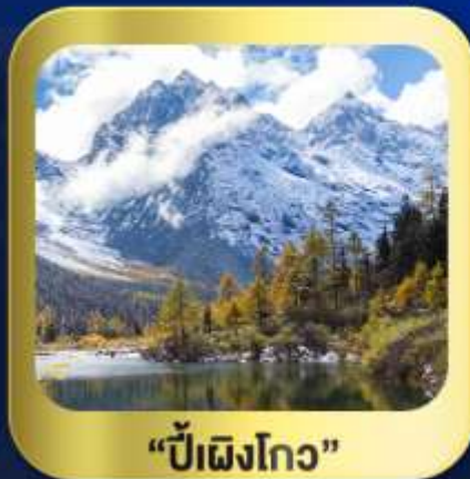
"ปี้เฉิงโกว"