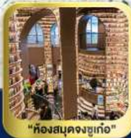
"ห้องสมุดจงซูเก๋"