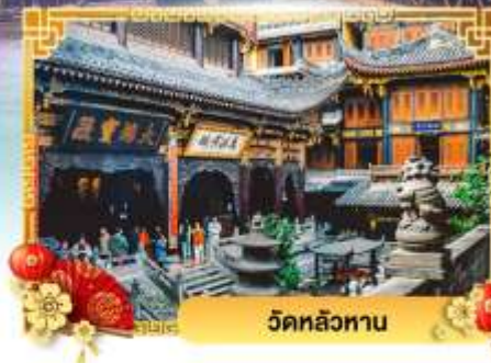
วัดหลัวหนาน