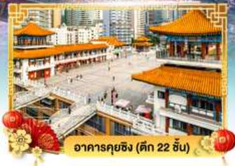
อาคารคิงซิง (ตึก 22 ชั้น)