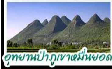
อุทยานป่าภูเขามื่นยอด

28 เม.ย. - 03 พ.ค. 69 ราคา 24,988 บาท 30 เม.ย. - 05 พ.ค. 69 ราคา 25,888 บาท 02-07 พ.ค. 69 ราคา 24,888 บาท 05-10 พ.ค. 69 ราคา 21,888 บาท 07-12 พ.ค. 69 ราคา 21,888 บาท 09-14 พ.ค. 69 ราคา 21,888 บาท หมู่บ้านคร้อยสายหม่นาหลังหือ - ล่องเรือทะเลสาบว่านเฟิงหู สะพานเขวนฮวาเจียง - อุทยานน้ำภูทาบหมื่นยอด บ้านคหวงกูซู - ถนนเก่าคูนหมิง เมบูพิศข สุกี้หิด ปลารสเปริวเม็ด ขมจีนข้ามสะพาน