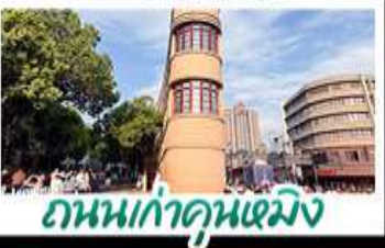
ถนนเก่าคูนหมิง