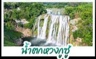
น้ำตกเขวงกูซู