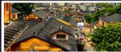
เมืองโบราณสี่ปาที้