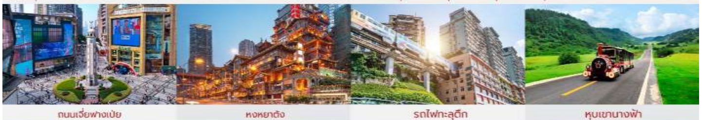
ถนนเจี๋ยฟางเป่ย์