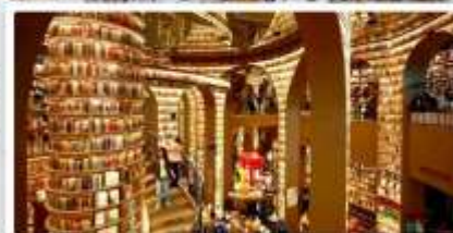
ร้านหนังสือจงซูเก๋

เดินทางโดย: สายการบินเฉิงตูแอร์ไลน์ (EU)