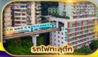
รถไฟเหาะลัดฟ้า