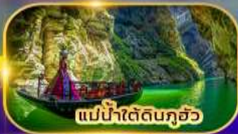
แม่น้ำใต้ดินกุอัว