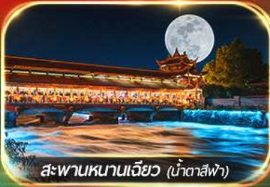
สะพานหนานเจียว (น้ำตาสีฟ้า)