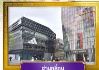
ชานหลู่กุน