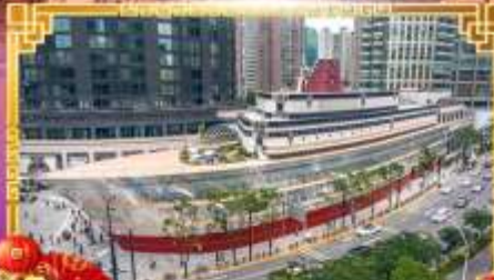
เรือหลุยส์วิคตอง