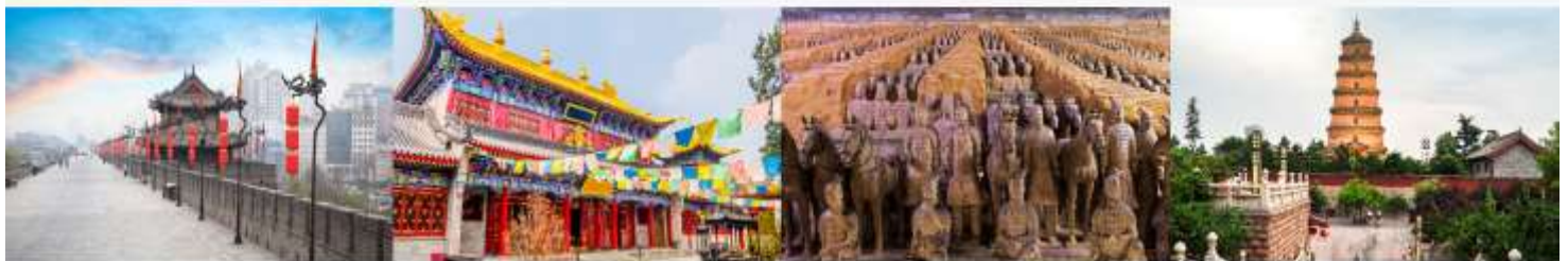
กำแพงเมืองโบราณ