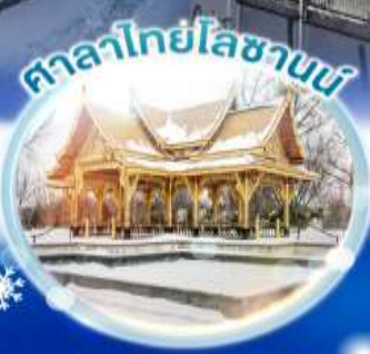
ศาลาไทยโลซานน์