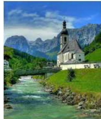
ออสเตรียบาวาเรียดินแดนแห่งเทพนิยาย

ออสเตรีย – บาวาเรีย (Austria-Bavaria) ดินแดนวัฒนธรรมเก่าแก่ที่ครอบคลุมสองประเทศและแทบแยกกันไม่ออกเลยที่เราเที่ยวอยู่ในออสเตรียหรือเยอรมัน ท่านจะประทับใจไปกับหมู่บ้านเล็กๆน่ารัก ที่ตั้งอยู่บริเวณริมทะเลสาบในเทือกเขา “เยอรมัน-ออสเตรียแอลป์” พร้อมบริการอาหารรสเลิศและที่พักอย่างดีระดับ 4 ดาว หลูหร่าที่เราคัดสรรมาให้ท่านได้พักผ่อนอย่างเต็มที่ให้การเดินทางของทุกท่านคุ้มค่าที่สุดในเส้นทางที่สวยงามที่สุดของออสเตรีย-บาวาเรีย