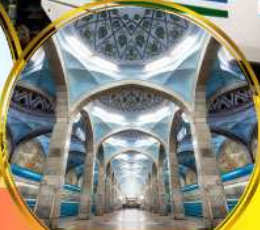
รถไฟฟ้าใต้ดิน