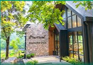
บ้านกาแฟ สวนสวย 168