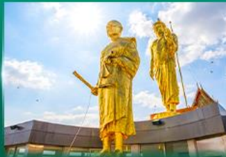
หลวงพ่อคูณ วัดบ้านไร่