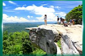
จุดชมวิวดาสุดาแผ่นดิน