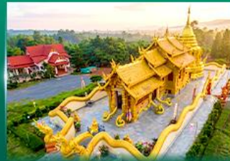
วัดเทพนิมิตประดิษฐ์